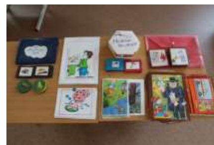
Игры «Здоровая еда», «Опасные предметы» «Можно – нельзя»