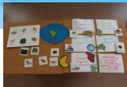
Материки и их обитатели